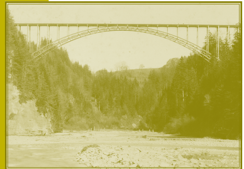
Köniz/Schwarzenbourg, pont du Schwarzwasser, 1882