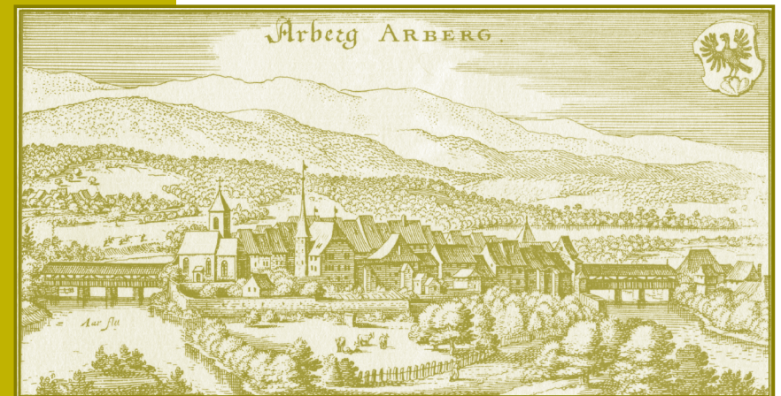
Aarberg um 1640, Kupferstich Matthäus Merian, 1593 – 1650